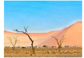
Désert du Namib Namibie

Non ce n'est pas l'Arizona, ni le Namib... C'est le Rougier un désert dans l'Aveyron