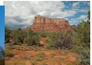
Grand Canyon Colorado Etats-Unis

Non ce n'est pas le Colorado aux Etats-Unis ! c'est le Colorado provençal à Rustrel situé dans le département de Vaucluse. Il se situe seulement à 591,36 km d'Orléans. Ça t'évitera de faire plus de 7000 km !