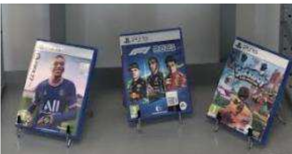
Morgann - Ayoub

Vous pouvez jouer à l'espace jeux vidéo en prenant rendez-vous avec une carte qui est gratuite à la création. Après avoir pris rendez-vous pour m minutes maximum vous pouvez jouer sur l'une des deux consoles. Vous ne pouvez pas jouer sur les deux consoles sur la même heure, ni sur la même journée.