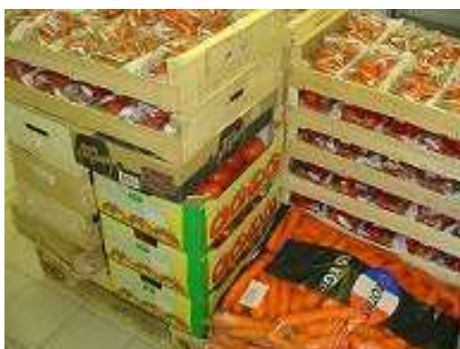
Les plats sont préparés et cuisinés sur place

Le chef cuisinier, Mathieu, est déjà sur place. La tâche est colossale. Au menu du jour une entrée à base de concombre, un tajine végétarien et des fraises. Une centaine de concombres doit être lavé, épluché et coupé. Pour la tajine, ce sont 110 kilogrammes de légumes frais qu'il faut préparer avant 11 heures. Avant la fin de la matinée, il faut également laver plus de 56 kilogrammes de fraises, les disposer et les répartir dans des ramequins.